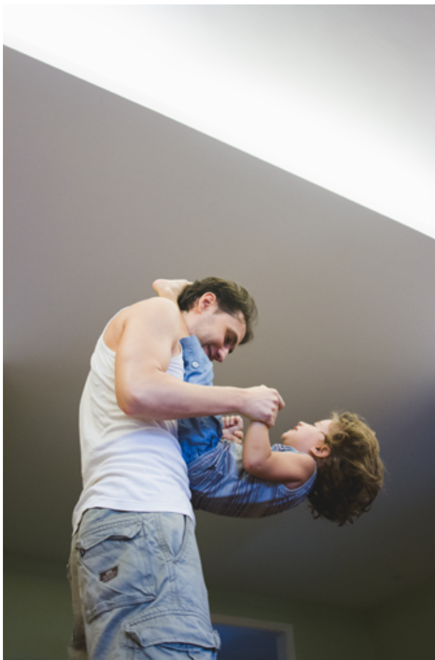
ficar de ponta-cabeça,